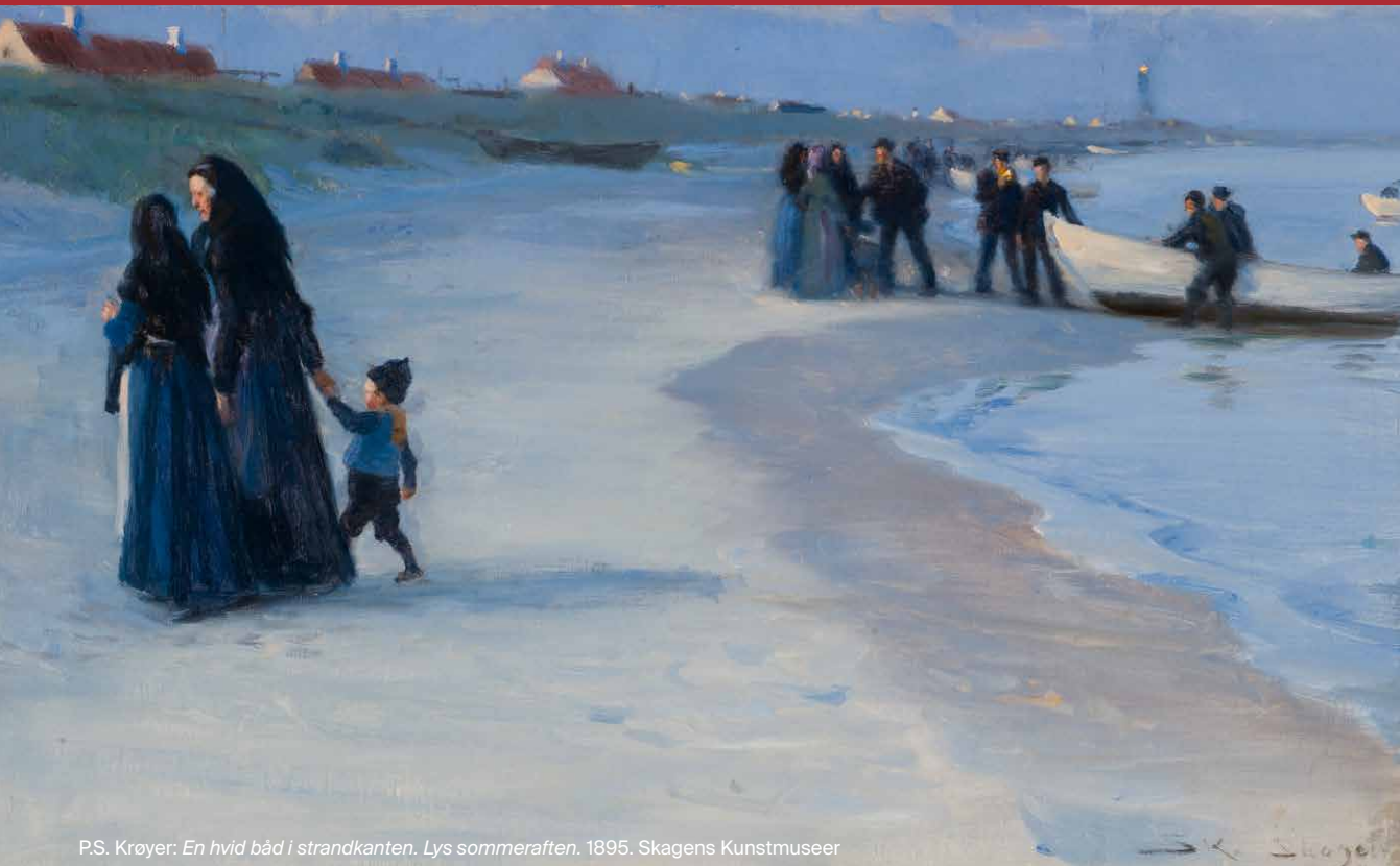
P.S. Krøyer: En hvid båd i strandkanten. Lys sommeraften. 1895. Skagens Kunstmuseer

Der afholdes samtaler den 12. og 13. november 2024. Vi håber, at du kan tiltræde stillingen med opstart 1. januar 2025 eller snarest muligt derefter.