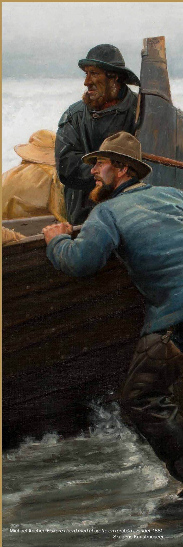
Michael Ancher: Fiskere i færd med at sætte en rorsbåd i vandet . 1881. Skagens Kunstmuseer

Der bliver rig mulighed for at sætte sit præg på den fremtidige formidlingsstrategi, hvor nøgleord som forståelse, aktualitet, relevans, samskabelse, brugerrejse og nytænkning bliver centrale. Så vi kigger efter en profil med en visionær og innovativ tilgang til at tænke formidling på tværs af organisatoriske fagområder.